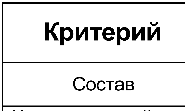
Рис.3.1. Общие черты и различия родовой и соседской общины

В рассматриваемый период Восточно-Европейская равнина была покрыта густыми лесами и пронизана реками. Этот природный фактор сыграл решающую роль в формировании экономического уклада древних славян.